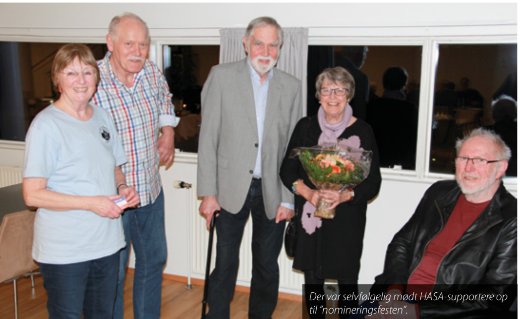
Der var selvfølgelig mødt HASA-supportere op til "nomineringsfesten".