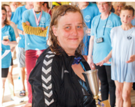
Heidi fra Sælungerne vandt God Tid Pokalen i 50 og 100 m.