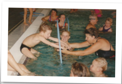
Træning i Lyseng, september 1994.