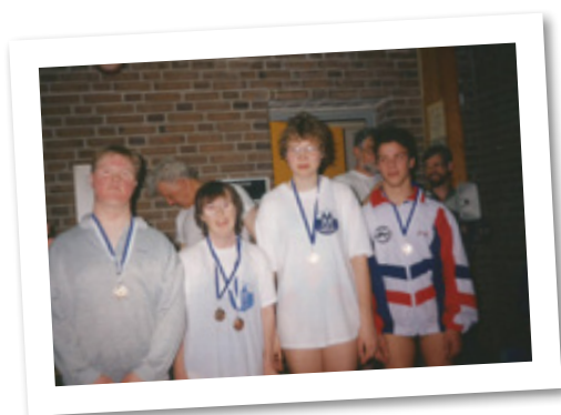
Stævne hos Sælungerne 1993.

I kan alle gætte med på, hvem vi ser på disse tre billeder?