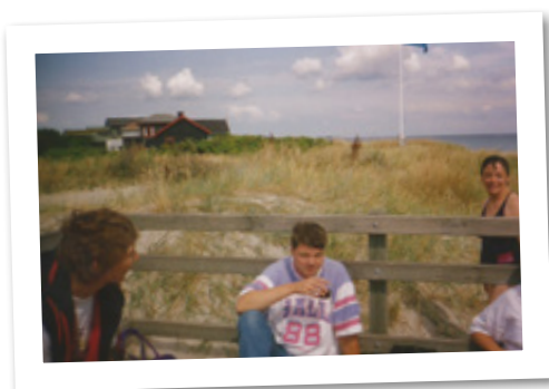
HASA-udflugt til Dronningens Ferieby i Grenå, sept. 1994