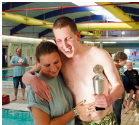
HASA's havde sendt to billeder til Frivilligcenter Aarhus' fotokongurrence. Her er det andet

at der kun er en svømmer, der for tiden kører med taxa.