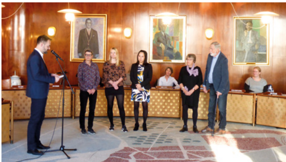
I november uddeltes Aarhus Kommunes Handicappris. HASA var indstillet til prisen sammen med Blindes arbejde og F.C. Bøgeskov, som fik prisen for deres inddragelse af udviklingshæmmede i det almene frivillige foreningsliv. Men al positiv omtale af HASA er værdifuld for klubbens arbejde

nede og erfarne instruktører og to nye fra efteråret.