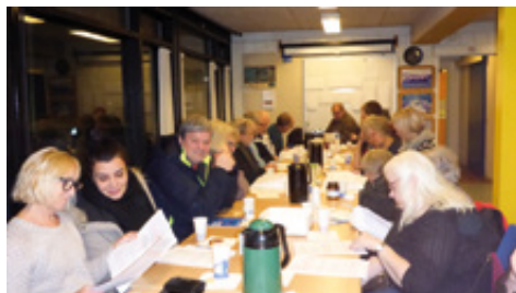
I november blev vedtægtsændringerne vedtaget på en ekstraordinær generalforsamling