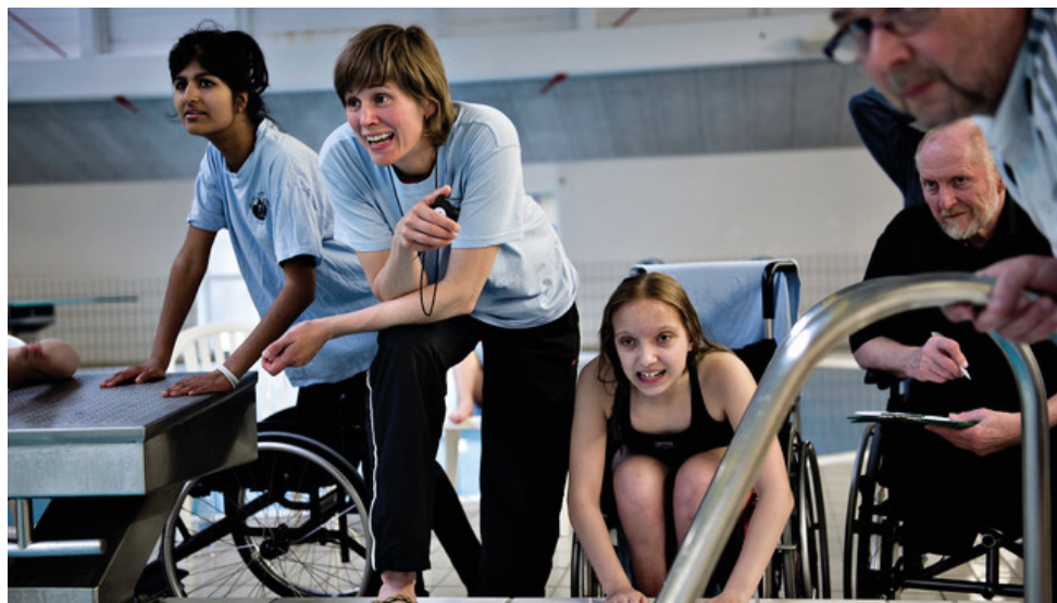
Vinderbilledet i Frivillighedscenter Århus' fotokonkurrence 2018