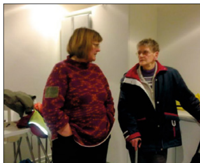
Gode råd til en musemor fra en gammel rotte