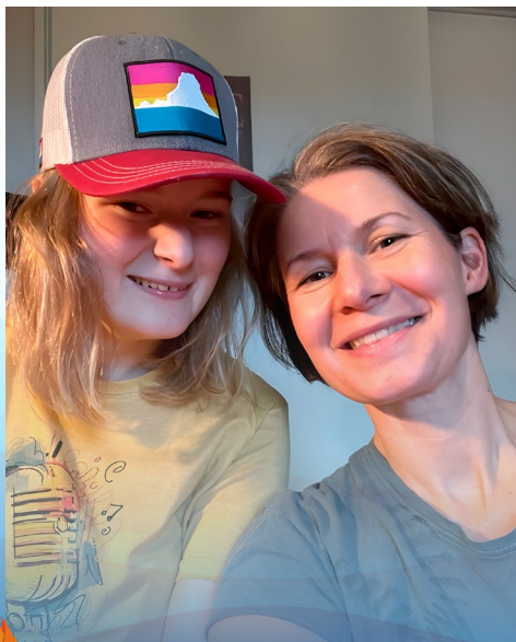
Trille og Gritt – et superteam!