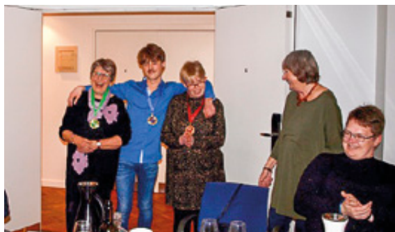
Vinderne af HASA-quizen.