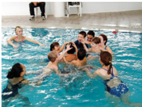
Billedet er fra et tidligere kursus.